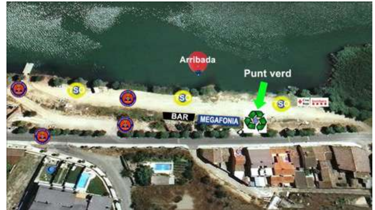
FINAL RECORREGUT 1: ARRIBADA SANT LLORENÇ