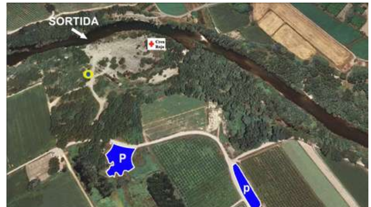
INICI RECORREGUT 2: GERB