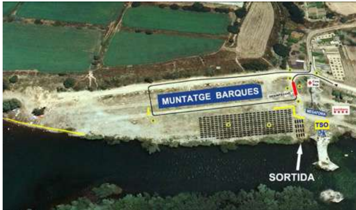
INICI RECORREGUT 1: SORTIDA CAMARASA