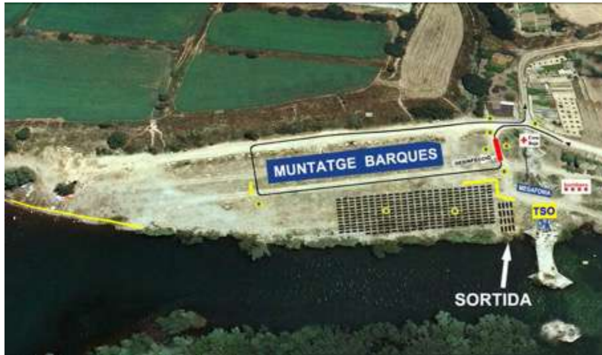
INICI RECORREGUT 1: SORTIDA CAMARASA