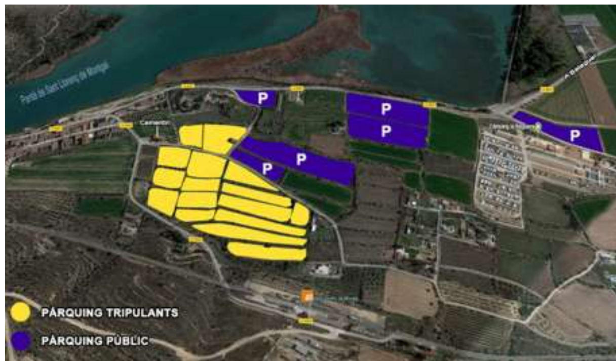
ZONA D'APARCAMENT SANT LLORENÇ